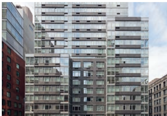
Nutzungsart Wohnen: Wohngebäude 88 Leonard Street, New York City, New York