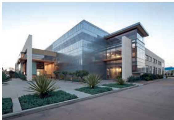
Nutzungsart Büro: Bürokomplex Lantana, Santa Monica, Kalifornien