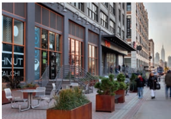
Nutzungsart Büro und Einzelhandel: Geschäftshaus Falchi Building, Long Island City, New York

Die Vorgängerfonds Jamestown 27, 28, 29 und 30 wurden wie auch Jamestown 31 als Blindpool konzipiert. Die getätigten Investitionen der Vorgängerfonds weisen eine breite Diversifikation auf. So wurden zahlreiche Gebäude mit verschiedenen Nutzungsarten in unterschiedlichen Metropolregionen der USA gekauft, bewirtschaftet und teilweise wieder verkauft – von Büro- über Einzelhandel- bis hin zu Mietwohnobjekten.