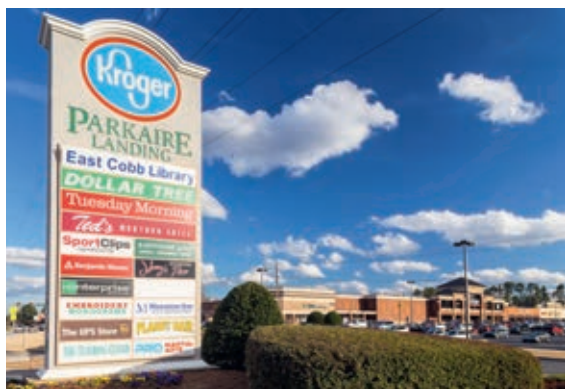
Nutzungsart Einzelhandel: Shopping Center Parkaire Landing, Marietta, Georgia